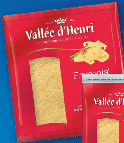
▲ Emmental grated 200 g, 500 g or 1000 g