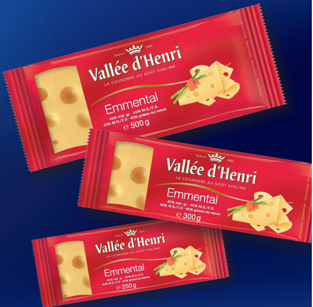
▲ Emmental portion 250 g, 300 g or 500 g