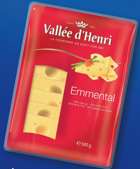
Tranches de fromage Emmental 500 g