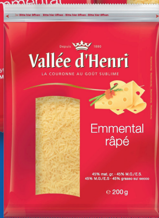
Emmental rallado 200 g, 500 g o 1.000 g